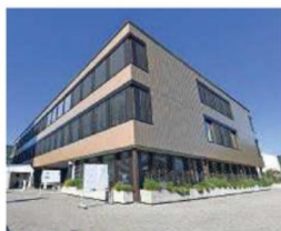
L'assainissement de l'école du Gros-Seuc a obtenu le label Minergie-Eco.

Ce concours, qui salue les communes s'engageant activement pour les questions énergétiques dans tous les domaines, met en valeur les collectivités locales, acteurs importants dans la promotion des énergies renouvelables et des méthodes de construction économes en énergie. Pour définir le classement, les responsables de ce concours se basent sur le nom-